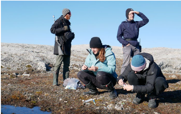
Auf der Hut vor Eisbären: Die Aufsammlung von Proben am Kongsfjord auf Spitzbergen erfolgt unter strengen Sicherheitsvorkehrungen.

Wie verändert der Klimawandel das Leben in der Arktis? Antworten auf diese Frage können mikroskopisch kleine Algen geben. Kieselalgen, auch Diatomeen genannt, sind Lebensgrundlage für Krill und Krebstiere und stehen damit auch am Anfang der Nahrungsnetze vieler Vögel und Fische. Sterben bestimmte Kieselalgenarten aus oder verschieben sich ihre Lebensräume aufgrund von Temperaturveränderungen, so könnte dies einen Zusammenbruch von ganzen Nahrungsnetzen zur Folge haben. Auch für den Erhalt der Küsten spielen die Winzlinge eine elementare Rolle: Wie eine Art Klebstoff stabilisieren sie das Sediment gegen Wellen- und Gletscherbewegungen und verhindern oder verlangsamen so die Erosion.