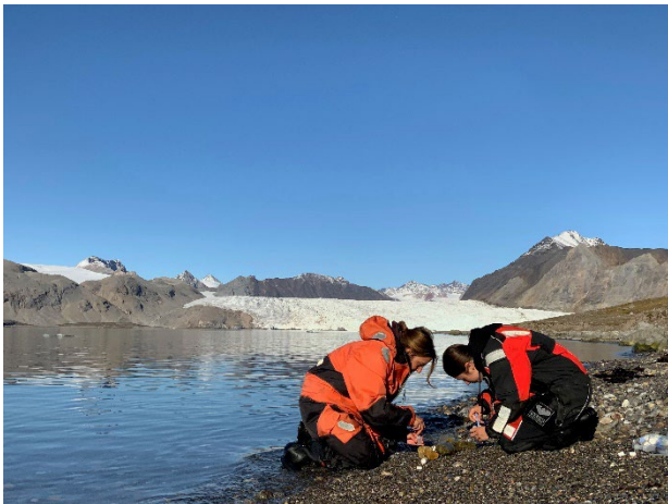
Wissenschaftler*innen entnehmen Biofilm-/Sedimentsproben mit Kieselalgen (Diatomeen) im Flachwasser der Insel Blomstrandhalvøya im Kongsfjord auf Spitzbergen.