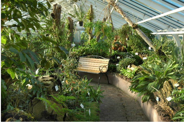
Grüne Welt: Im Orchideengewächshaus

Südamerika mit zurück nach Berlin gebracht – zum Beispiel Dichaea kegelii aus Französisch-Guayana.