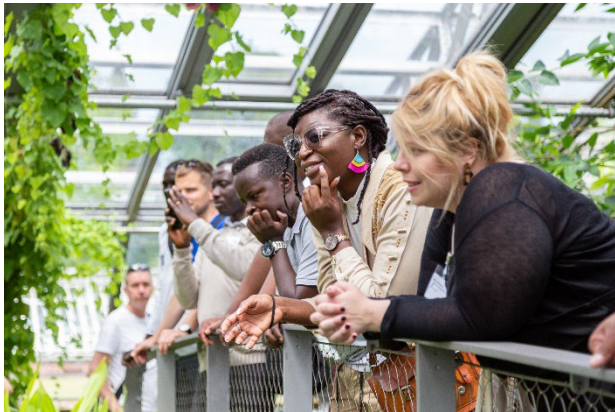
Stipendiat*innen im Botanischen Garten