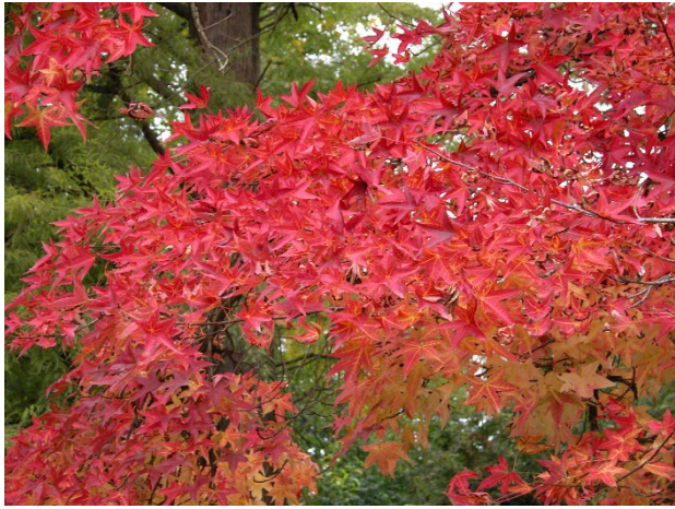
Amerikanischer Amberbaum ( Liquidambar styraciflua )

Das herbstliche Farbenspiel hat begonnen: Auf einem Spaziergang durch den Garten begeistern nun die vielfältigen Verfärbungen der Blätter – besonders rund um den Amerikasee wecken unter anderem Amberbaum und Tulpenbaum ( Liriodendron tulipifera ) ein besonderes „Indian Summer“-Feeling. Ein Stück weiter im Bereich Japan wartet ein weiteres Herbst-Highlight: Die ersten Blätter des Kuchenbaums ( Cercidiphyllum japonicum ) fallen herab und duften verführerisch nach frischem Backwerk. Besonders gut lässt sich der Duft übrigens bei feuchter Witterung erschnüffeln. Gleich nebenan, unweit des Japanpavillons, sind die imposanten Ginkgobäume ( Ginkgo biloba ) mit ihren leuchtend gelben Blättern nicht zu übersehen.