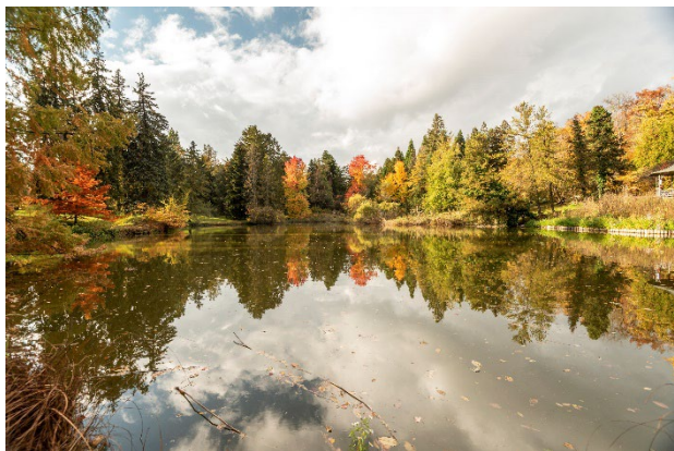
Blick über den Amerikasee

Eine wichtige Info: Im Rahmen umfassender Modernisierungsmaßnahmen erneuern wir derzeit unsere Gartenwege. Bei Regen und Schnee sollen sie in Zukunft sorgen- und barrierefrei begehbar sein. Welche Wege aktuell betroffen und welche Bereiche kurzfristig geschlossen sind, erfahren Sie immer aktuell hier auf unserer Webseite .