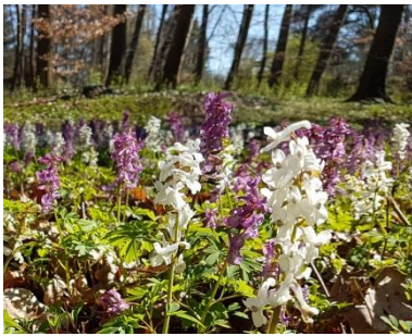
Hohler Lerchensporn ( Corydalis cava ) im Rotbuchenwald