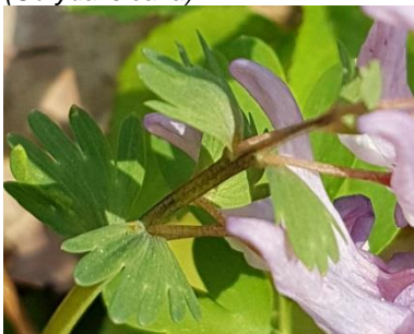
Tragblatt beim Gefingerten Lerchensporn ( Corydalis solida )