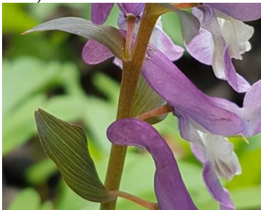
Tragblatt beim Hohlen Lerchensporn ( Corydalis cava )