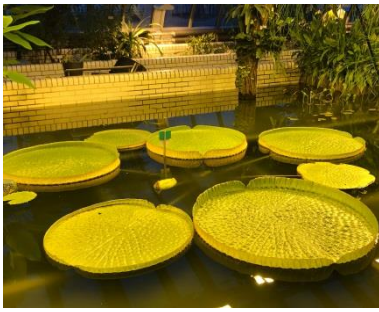
Pflanze am 26.03.2019