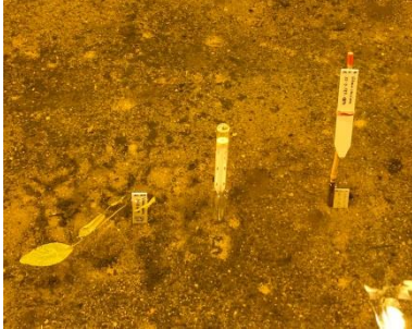
Und zur Erinnerung: so klein war die Keimling noch am 22.01.2019, das Blatt kaum größer als ein Daumen

ziert, vielen Dank an die Elefanten im Zoologischen Garten. Auch die zweite Riesenseerosenart Victoria amazonica ist gekeimt. Die weitere Entwicklung der Pflanze wird zeigen, ob es sich um reines Saatgut handelt. Wir sind gespannt. Die Art Victoria amazonica bildet noch größere Schwimmblätter aus, deren Rand jedoch auch im ausgewachsenen Alter nicht prominent erhoben ist.